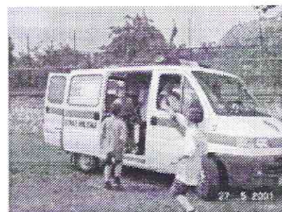
Radiowóz Straży Miejskiej na festynie organizowanym przez Radę Osiedla Powstańców Śląskich.

Tekst ze strony internetowej Urzędu Miasta W-wia