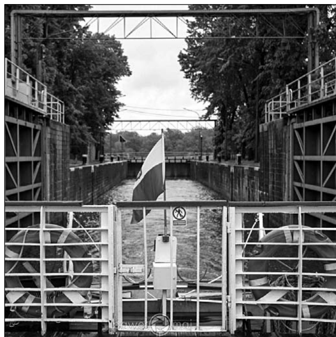
Śluza Szczytniki

Bardzo dużo osób było chętnych na ten rejs, jednak na statku obowiązują rygorystyczne przepisy, które w tym przypadku pozwalają zabrać na pokład 140 osób