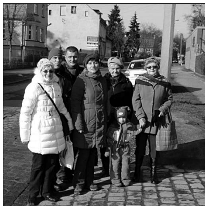
Fot. nr 4 – Akcja prasowa, luty 2013 r.

W roku 2015 Miasto wpisało remont ul. Osobowickiej do programu pn. „Strategia Zintegrowanych Inwestycji Terytorialnych Wrocławskiego Obszaru Funkcjonalnego” w celu uzyskania dofinansowania ze środków unijnych. Jednak tym ruchem spowodowane zostało wstrzymanie jakichkolwiek działań do czasu rozstrzygnięcia konkursu. W tym czasie Rada uzyskała dostęp do projektu przebudowy, który został opublikowany na stronie RO. Jednocześnie ogłoszone zostały konsultacje społeczne w sprawie zgłaszania uwag dotyczących tego projektu. Konsultacje rozpoczęły się w grudniu 2016 r.