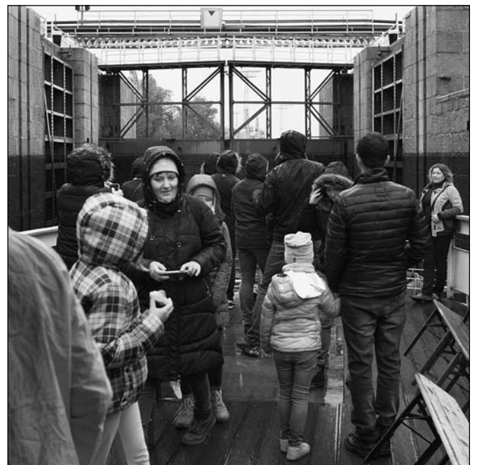
Śluza Miejska