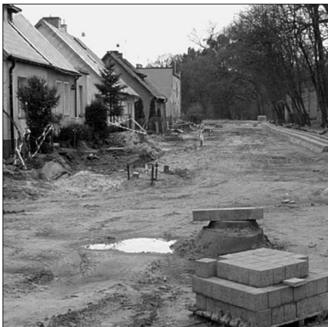
Fot. nr 3 – Początek przebudowy ul. Lipskiej, kwiecień 2010 r.

Policja, Strażą Miejską i Inspektoratem Transportu Ciężarowego (obecnie Drogowego), żeby powstrzymać ten tranzyt. Kończyły się już granice wytrzymałości ludzi i nawierzchni drogi. Wypiętrzenie bruku na łuku placu Wyzwolenia groziło wstrzymaniem ruchu Komunikacji Miejskiej, często dochodziło do zniszczenia podwozia samochodów osobowych. Pewnego majowego wieczoru mieszkańcy zablokowali możliwość przejazdu samochodom ciężarowym. W ciągu kilku minut zatrzymano kilkadziesiąt ciężarówek i betoniarek zmierzających do Rędzina. Po bardzo nerwowych negocjacjach przepuszczono transport, a Policja zobowiązała się do ciągłego monitorowania ulicy. Na wniosek Rady Osiedla na zjeździe z mostu Millenijnego postawiono znak zakazu ruchu samochodom powyżej 9 ton. Już wcześniej mieszkańcy Rędzina wstrzymali ruch ciężarowy poprzez wnioskowanie o zakaz ruchu samochodom ciężarowym powyżej 5 ton.