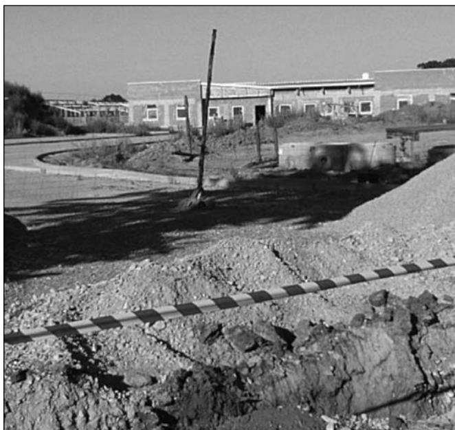
Fot. nr 1 – Budowa schroniska dla zwierząt, wrzesień 2009 r.

W czerwcu 2009 r. rozpoczęła działalność Rada Osiedla V-ej kadencji, która przejęła zadania po poprzednikach. W tym czasie trwała już budowa Schroniska dla Zwierząt, które we wrześniu tego roku wyglądało jak na fotografii nr 1.