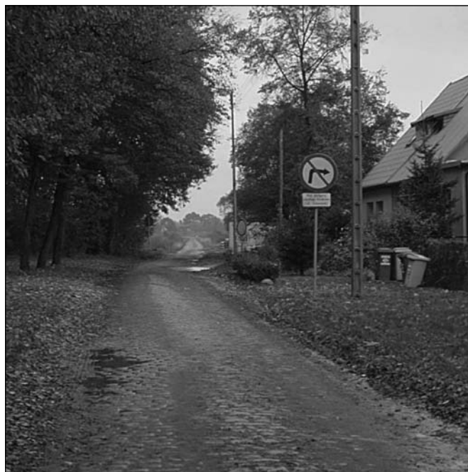
Fot. nr 2 – Stara ulica Lipska, marzec 2010 r.

Na początku roku 2010 przystąpiono do przebudowy ulic Lipskiej i Ślazowej. Jeszcze w marcu skrzyżowanie tych ulic wyglądało jak na fotografii nr 2, a już w kwietniu prace przy przebudowie szły pełną parą i nie było śladu po bruku, co przedstawia fotografia nr 3.