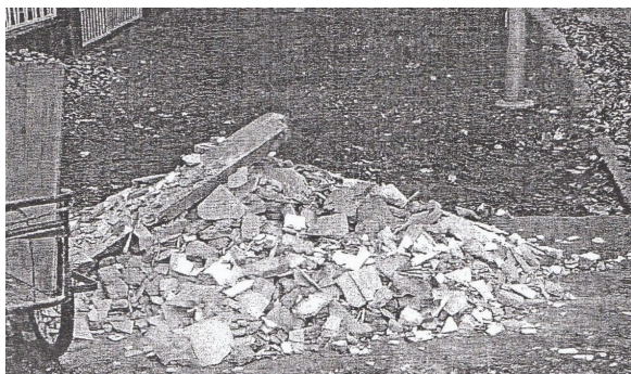
Śmieci ul. Jastrzębia