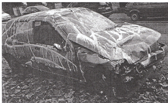
Wrak przy ul. Jastrzębiej