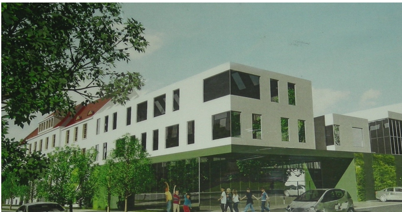
Widok Szkoły Podstawowej nr 47